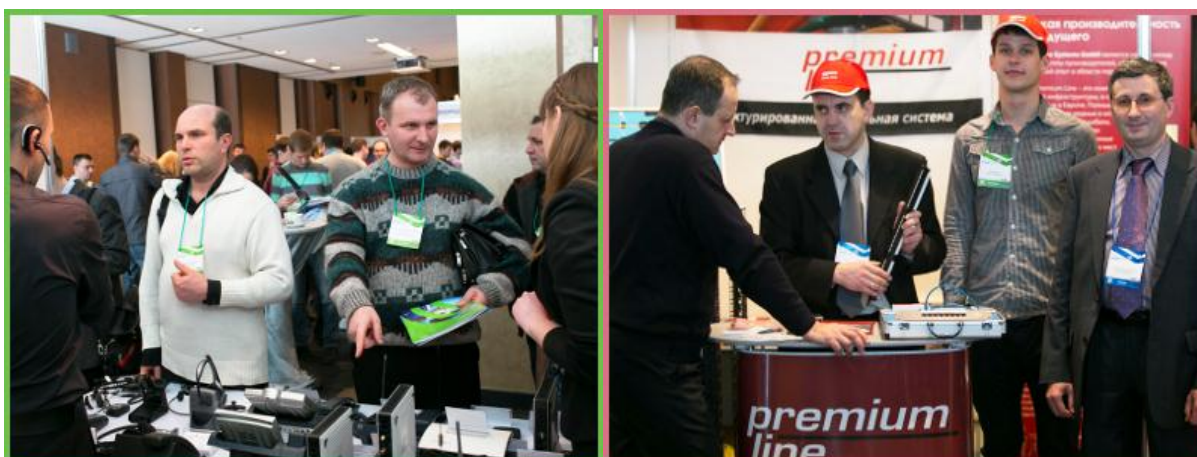
Посетители Форума активно интересовались оборудованием, представленным в выставочной части ACAIP-2013

Панельная дискуссия вызвала небывалый интерес среди посетителей, а их было несколько сотен! Люди активно задавали вопросы экспертам, делились мнениями, высказывали свою точку зрения по поводу спорных ситуаций, обсуждали как технические, так и экономические нюансы этого сегмента рынка. Можно смело утверждать, что такого горячего обсуждения на тему СКС в ИКТ-сообществе давно не было . Это мнение подтверждают также все участники панельной дискуссии, многие из которых отдельно поблагодарили организаторов за столь удачный формат обсуждения и качественный состав участников.