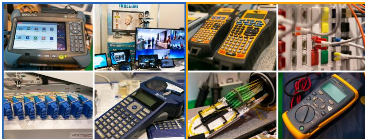
В выставочной части мероприятия свои решения представляли производители и поставщики со всего мира

В частности ИК15 отвечает за разработку стандартов, касающихся инфраструктуры оптических транспортных сетей, сетей доступа, домашних сетей, энергосистем общего пользования, измерительного оборудования, оптических волокон, кабелей и пр. Эта деятельность включает также разработку соответствующих стандартов, касающихся помещений потребителя, городских и междугородных участков сетей связи, а также сетей и инфраструктуры энергосистем общего пользования от передачи до нагрузки.