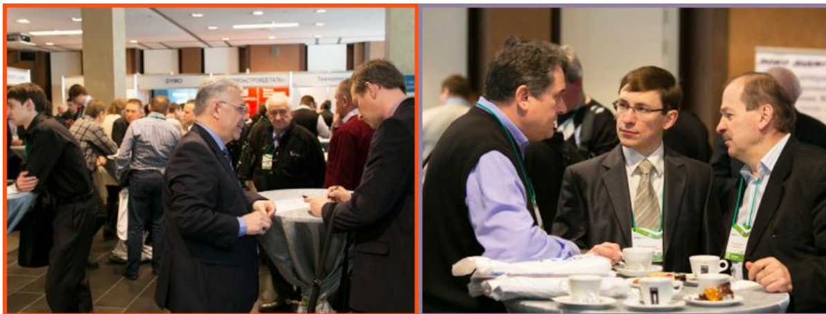
Посетители ACAIP-2013 активно общались и искали оптимальные варианты решения конкретных задач